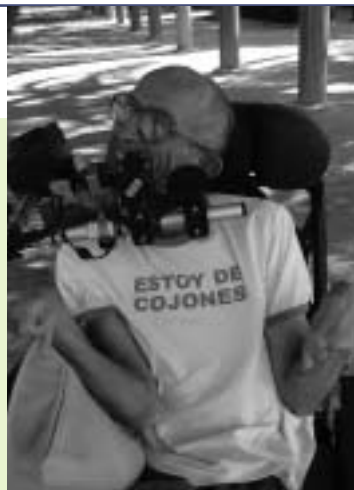
Junto a estas líneas, la foto ganadora. A la izq., la que recibió el 2º premio, y bajo estas líneas, la premiada en tercer lugar.